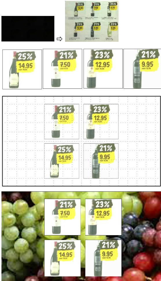
Folie 1: Ergebnis